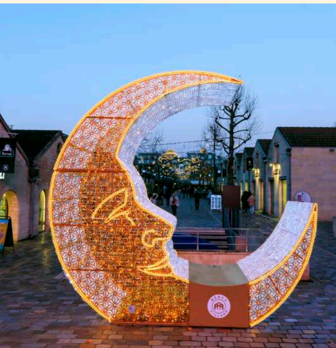
Bercy Village, Paris, France