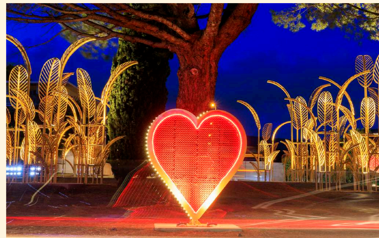
La Ciotat, France