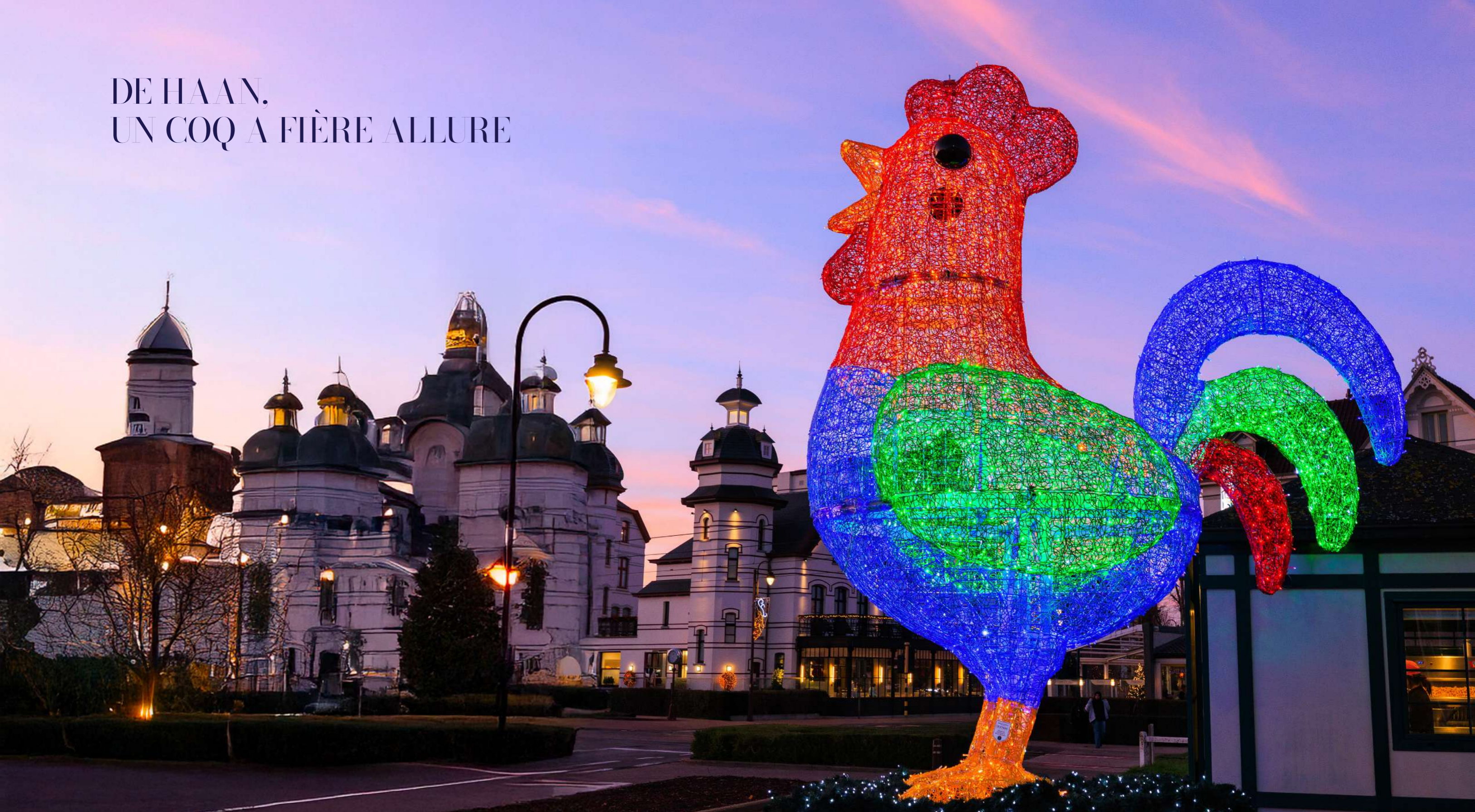
De Haan, Belgium