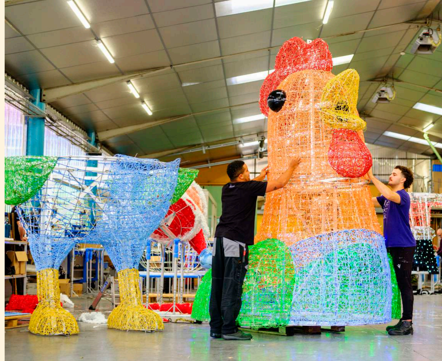
Blachere Illumination, Apt, France

Face à la mer du nord se trouve le charmant village de De Haan, qui a choisi cette année de célébrer l'emblème de la commune avec panache : un coq haut en couleurs.