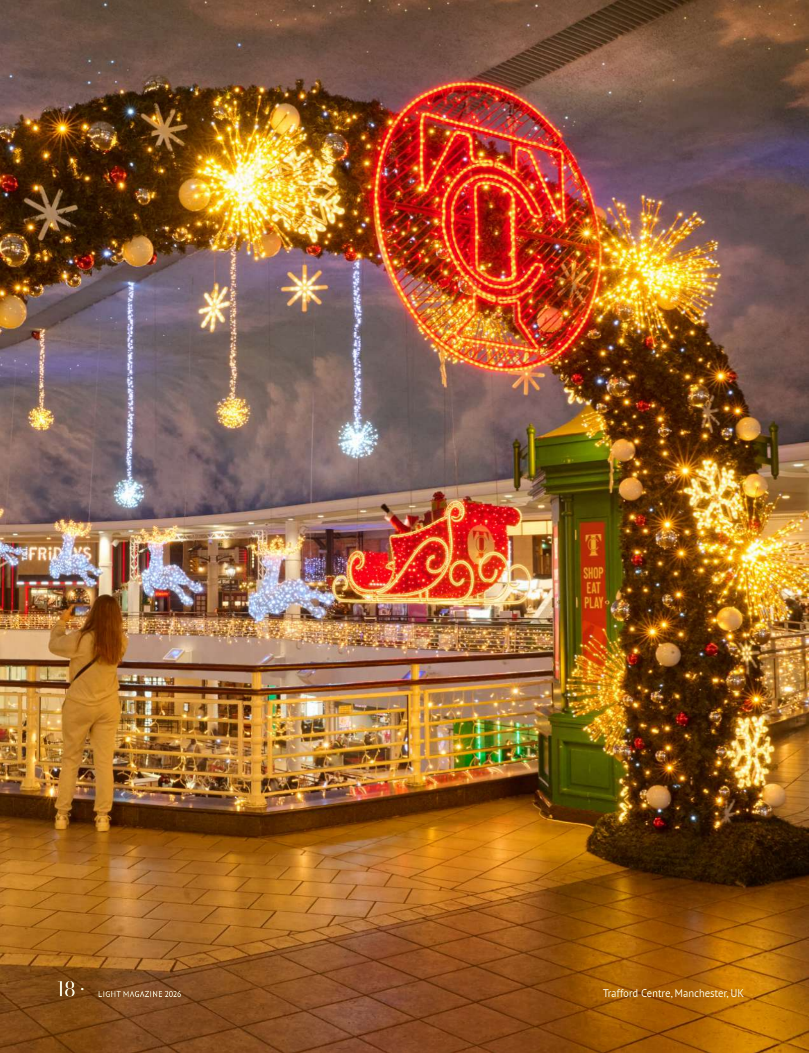
Trafford Centre, Manchester, UK