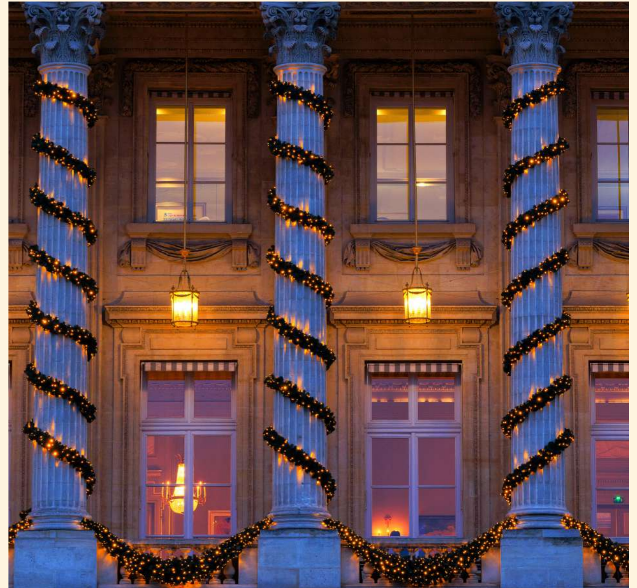
Hôtel Le Crillon, A Rosewood Hotel, Paris, France