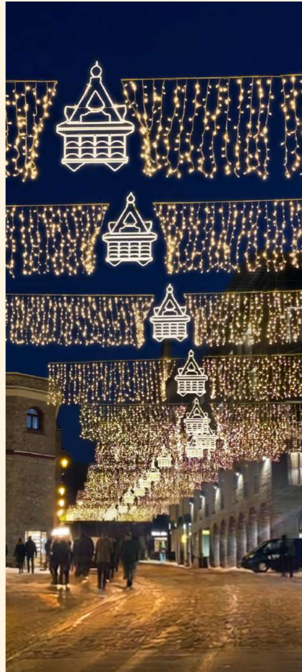
St Moritz, Switzerland