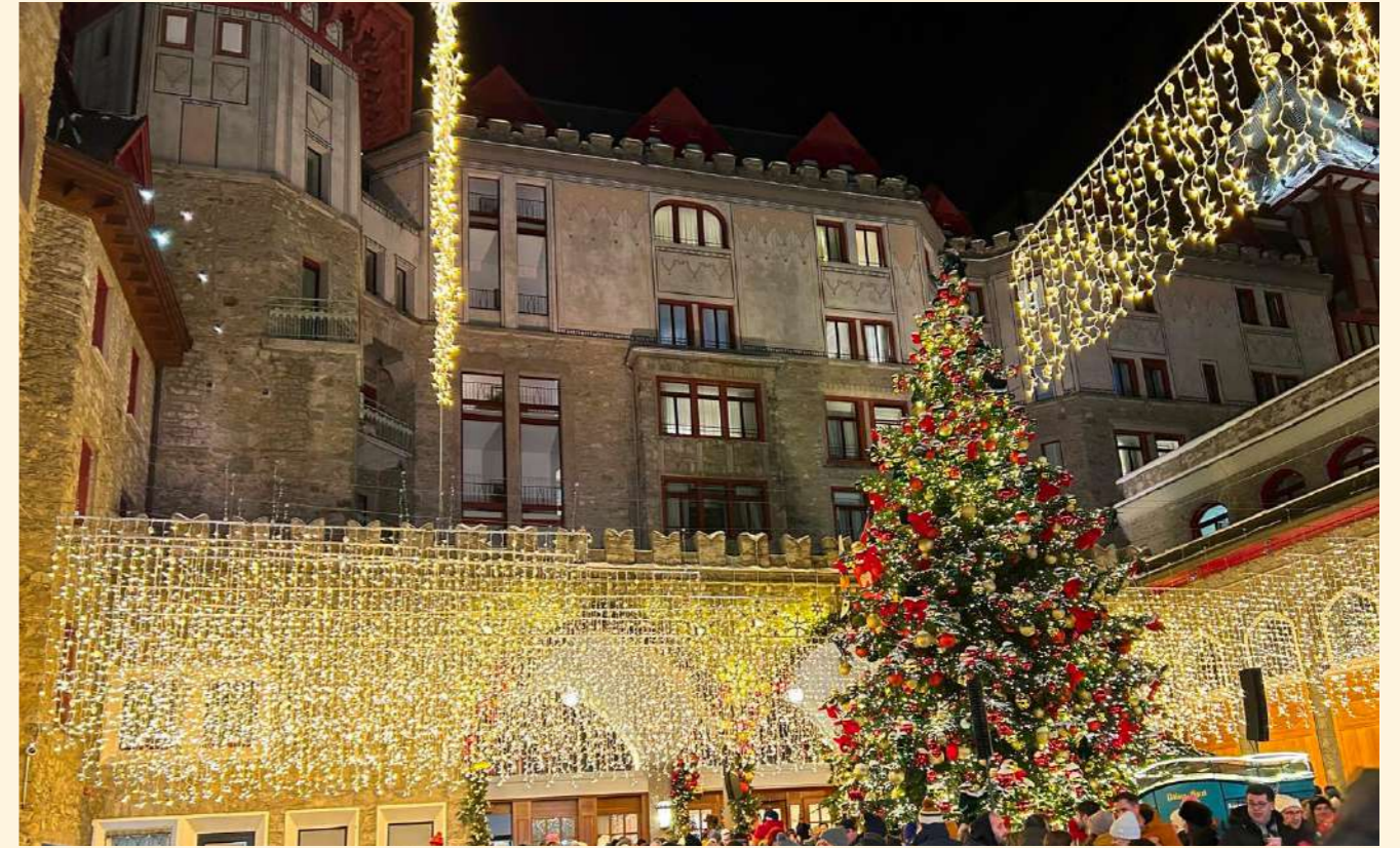
Badrutt's Palace, St Moritz, Switzerland

Light reveals architecture with elegance and character, enhancing every detail.