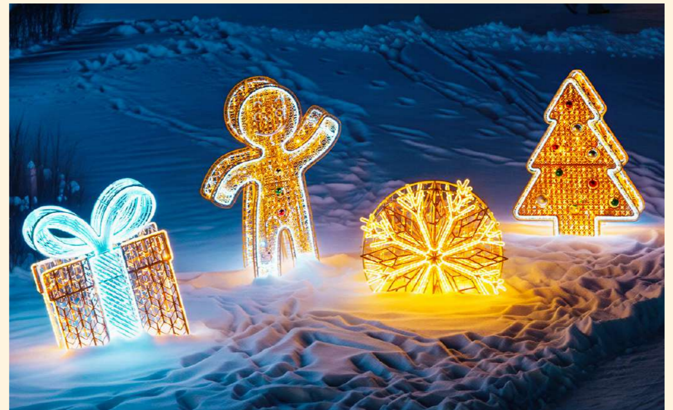
Lesana Hotel, Stará Lesná, Slovakia