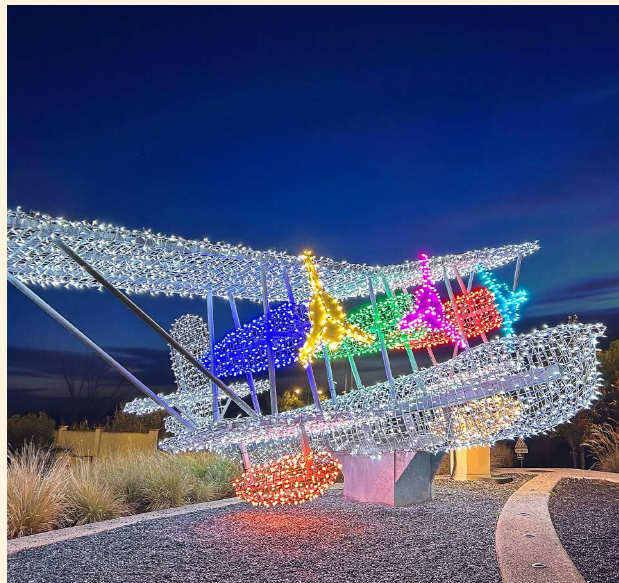
Berre L'Étang, France