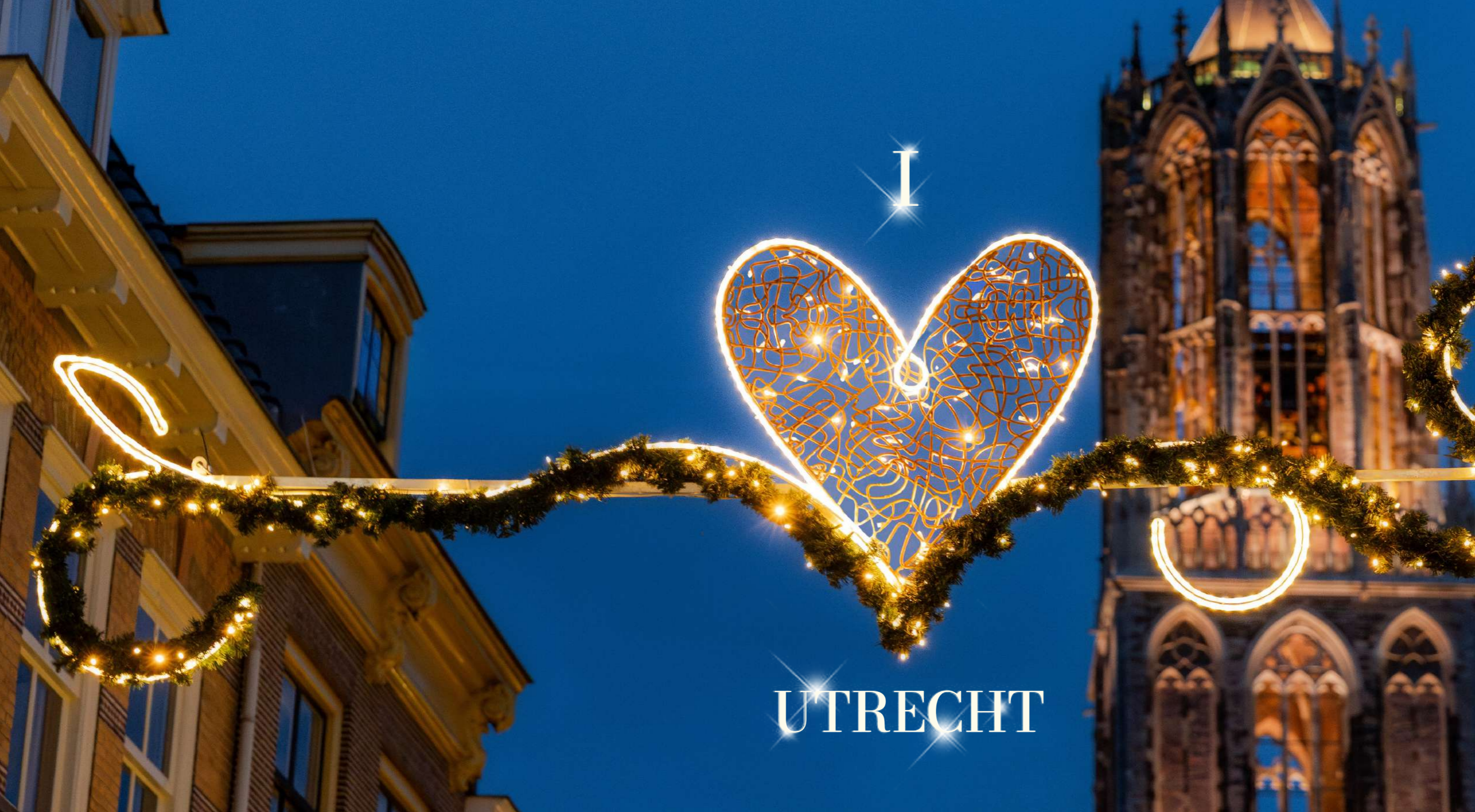
Utrecht, The Netherlands