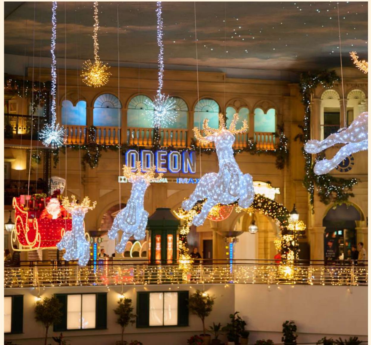
Trafford Centre, Manchester, UK