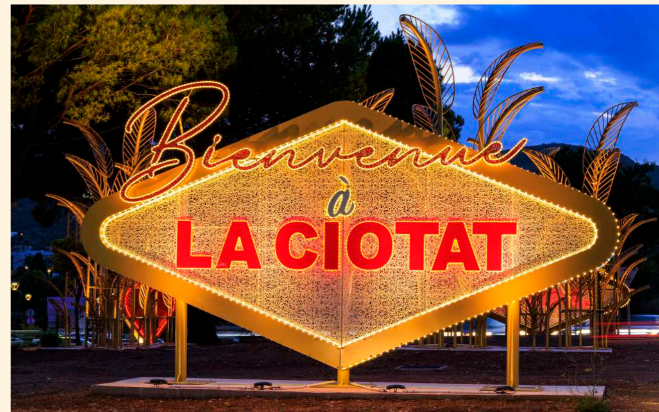
La Ciotat, France

Longer days invite us outside, into vibrant, shimmering spaces that celebrate the season.