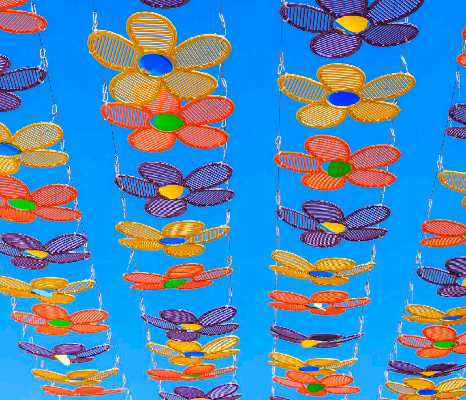
La Ciotat, France