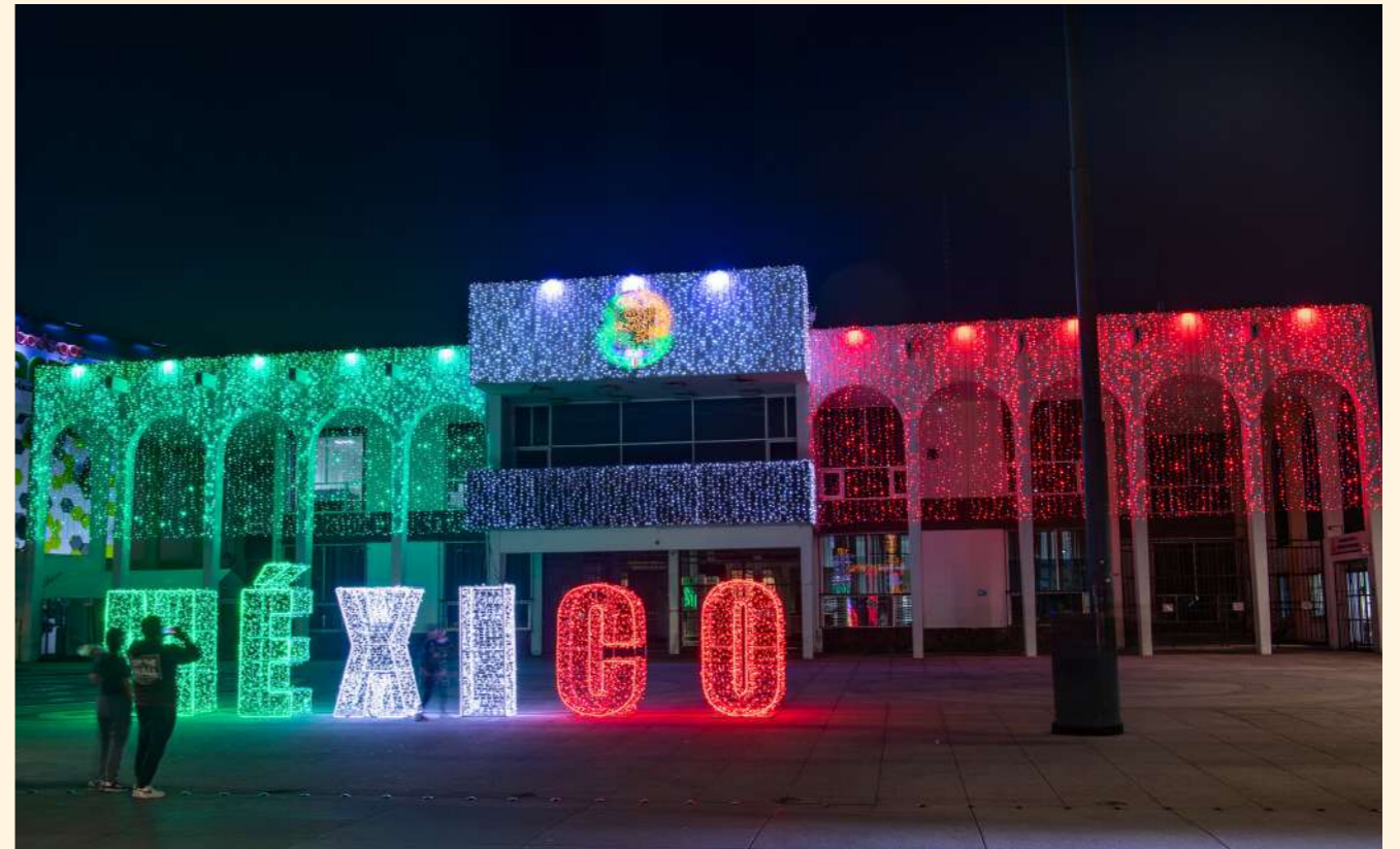
Chalco de Diaz Covarrubias, Mexico