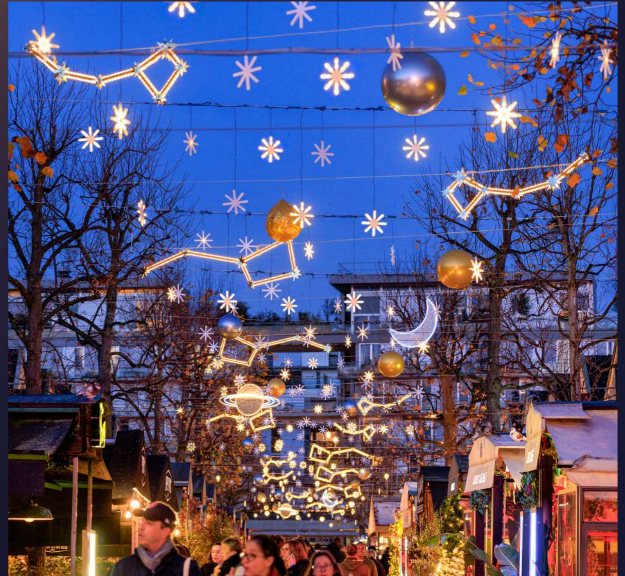
Bercy Village, Paris, France