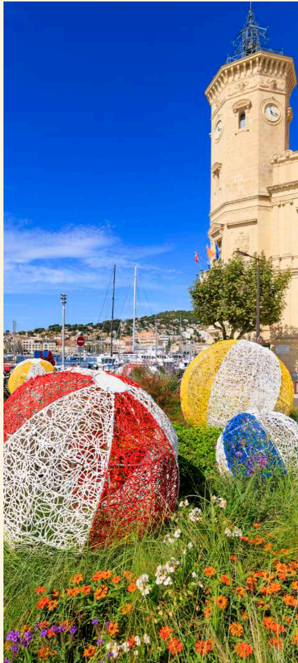
La Ciotat, France