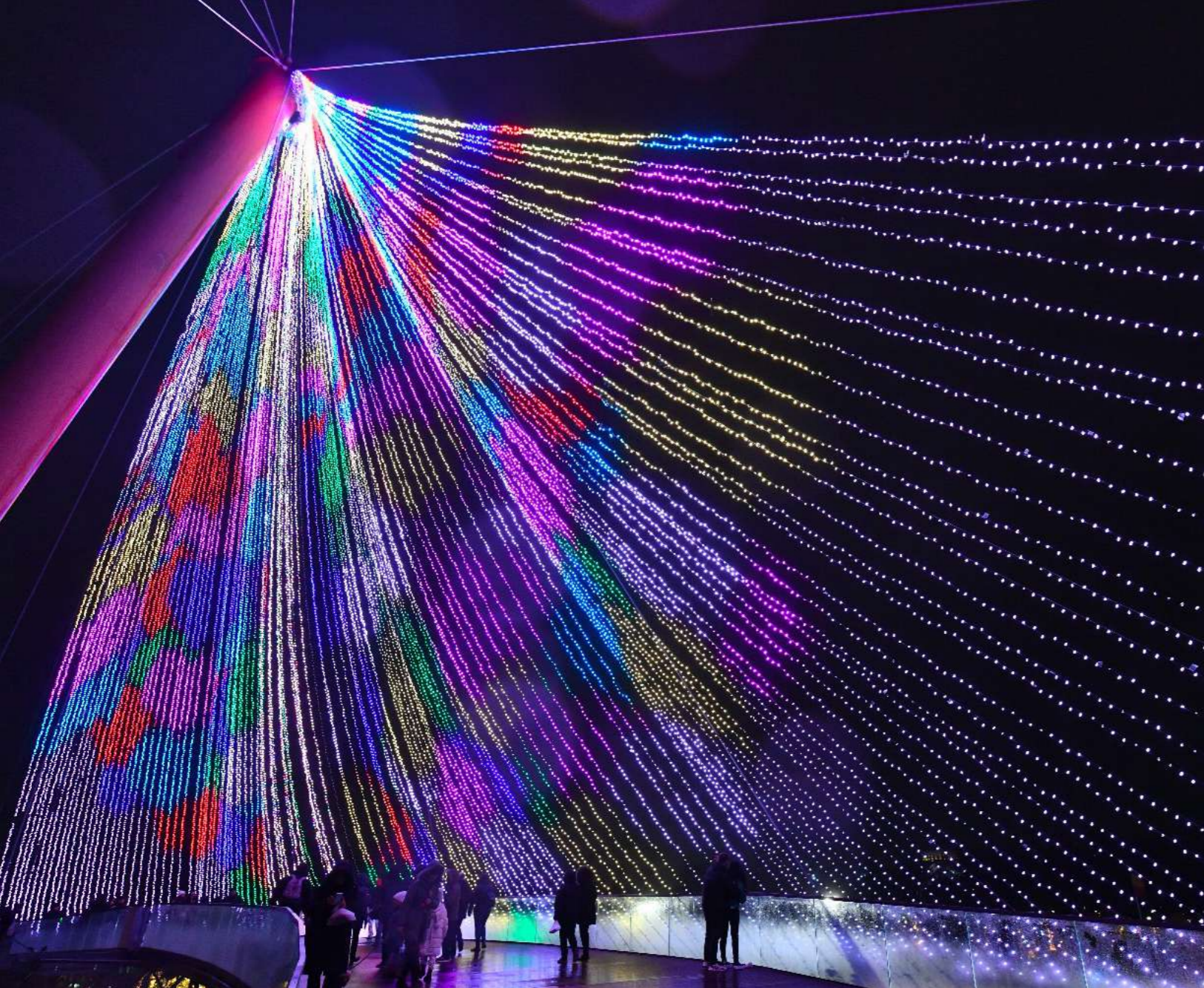
Bucharest, Romania. Flash Lighting Services